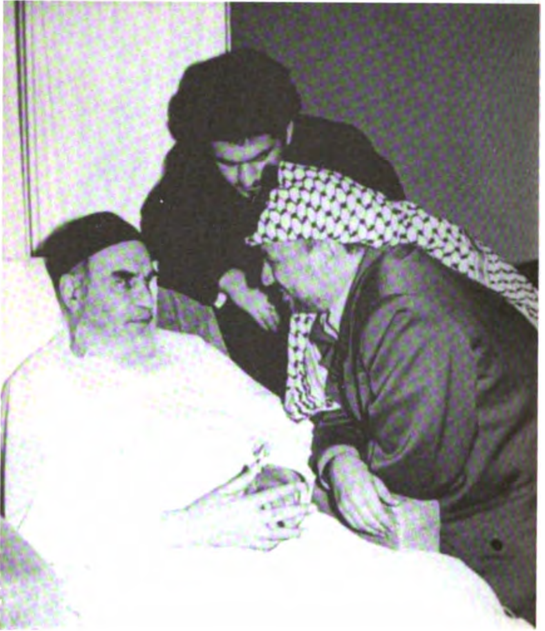
مع زعيم الثورة الإيرانية الإمام الخميني